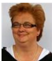
Els Heuvelmans Jeugdarts

Dit zijn de medewerkers die verbonden zijn aan uw school: